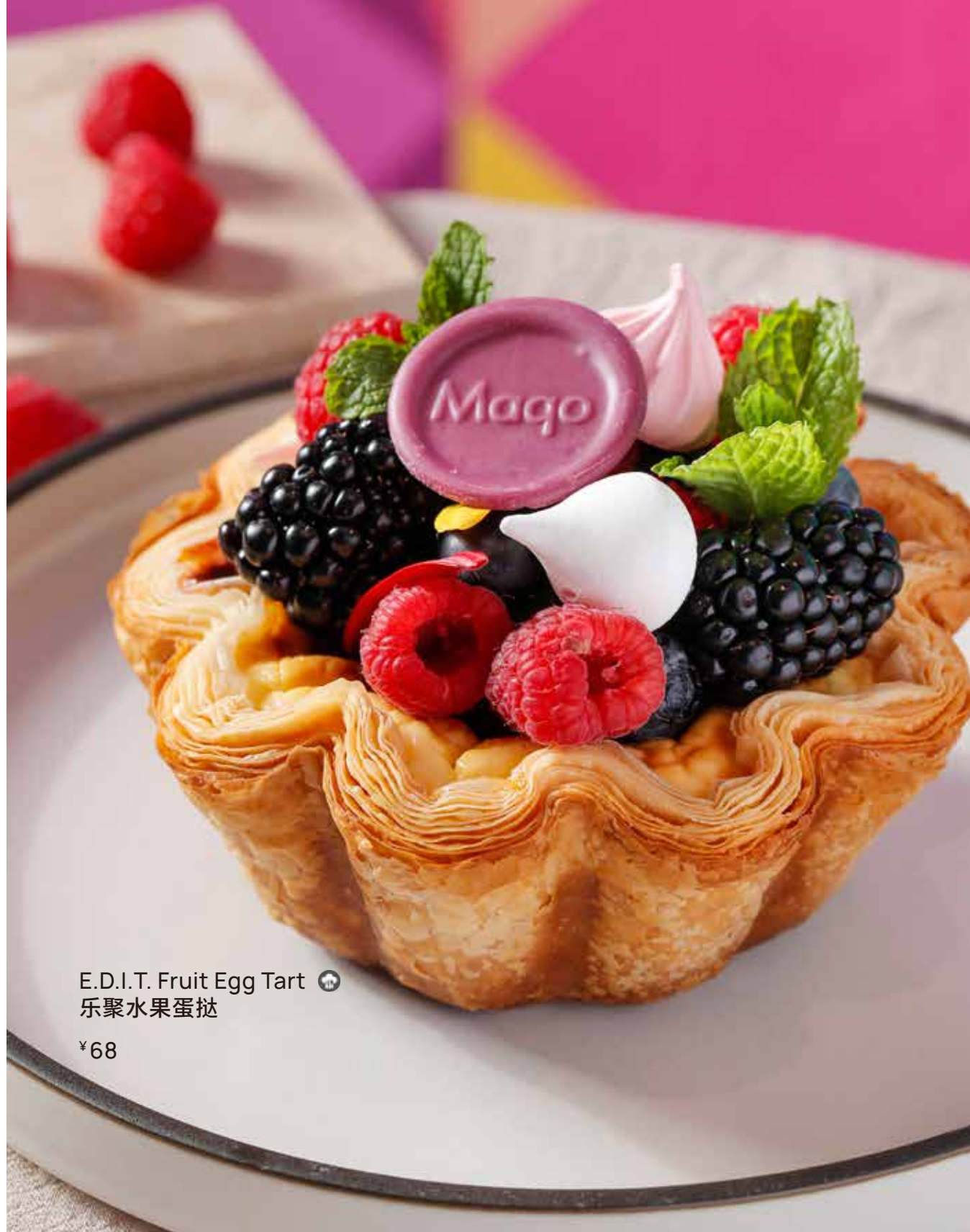
E.D.I.T. Fruit Egg Tart 🍷 乐聚水果蛋挞