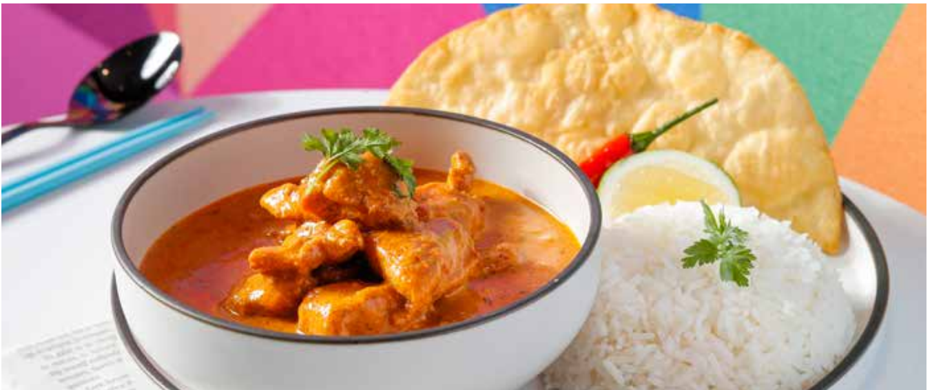
Indian Butter Chicken Curry Rice | Cashew | Tomato Gravy 🍴 印度黄油咖喱鸡 | 腰果 | 米饭 | 番茄 | 肉汁