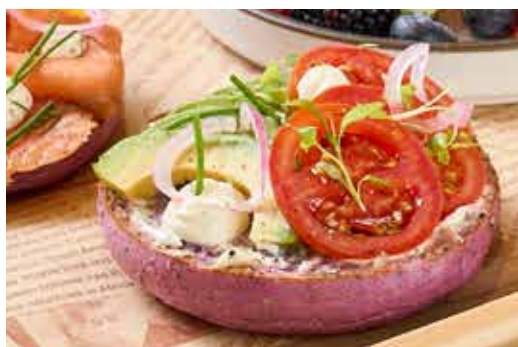
Low Calorie Avocado Power Bagel 🍷 低卡路牛油果贝果