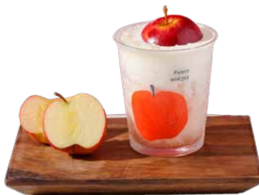
Escaped Apple 出逃的苹果