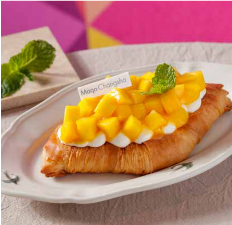
Fresh Mango | Cream | Croissant 芒果奶油可颂饼