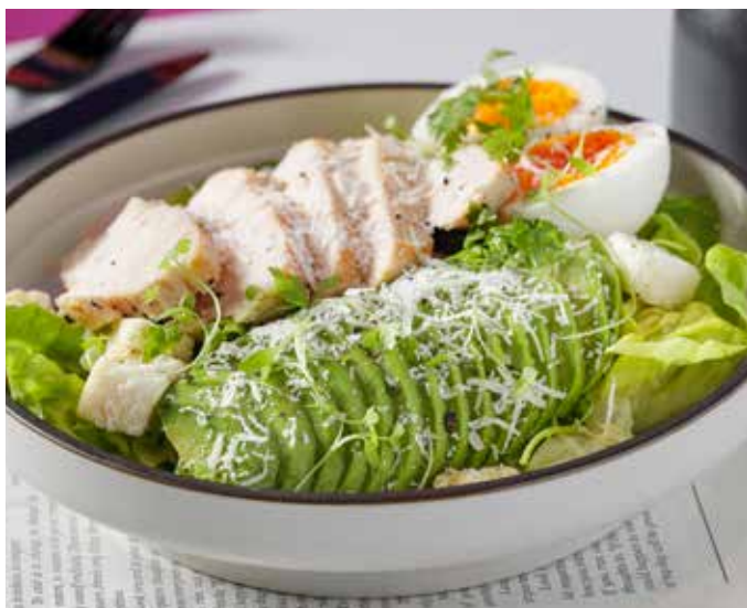
Avocado Chicken Salad 🌱🍴 牛油果鸡肉凯撒沙拉