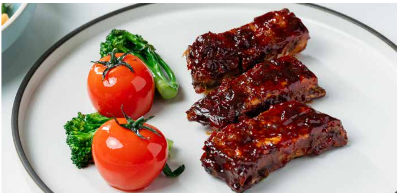
Slow Roasted Iberico BBQ Pork Ribs 低温慢烤伊利亚猪肋排