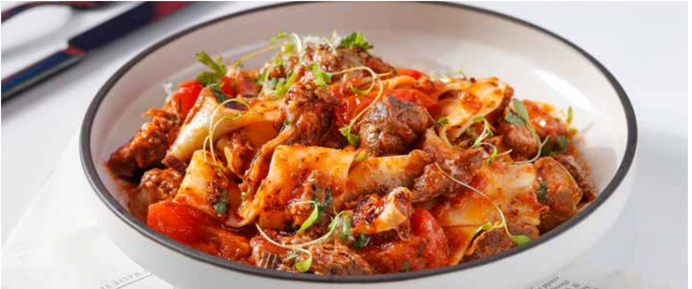
Hunan Spicy Braised Beef Brisket Tagliatelle | Parmesan 🍴🍷 湖南辣味慢炖牛腩 | 宽面 | 帕马森芝士