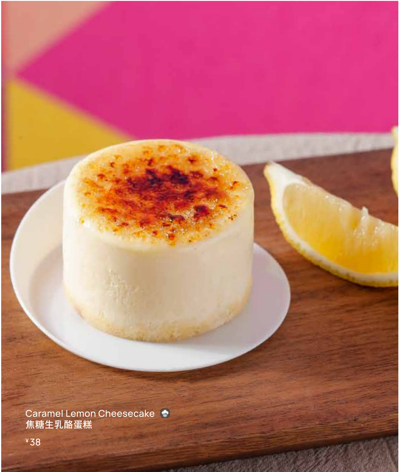
Caramel Lemon Cheesecake 🍷 焦糖生乳酪蛋糕