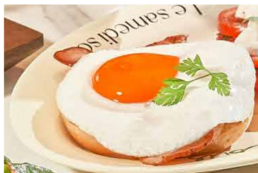
Bacon & Egg Bagel 培根及鸡蛋贝果

Avocado | Lite Sour Cream Vine Tomato | Mixed Seed Crunch 牛油果 | 低脂酸奶油 | 带枝番茄 | 混合果仁脆片