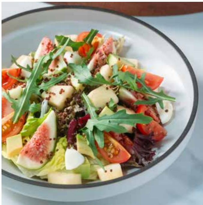
Quinoa Apple Cheese Fig Salad 🌱🍴 藜麦无花果苹果芝士沙拉