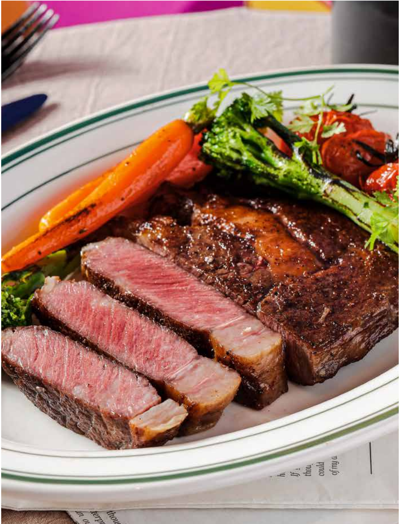
Australian Wagyu Rib-Eye M3+ 原切澳洲M3+和牛肉眼扒 (220G)