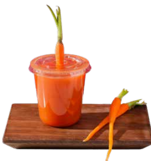
Mixed Fruit and Carrot Juice 水果胡萝卜汁