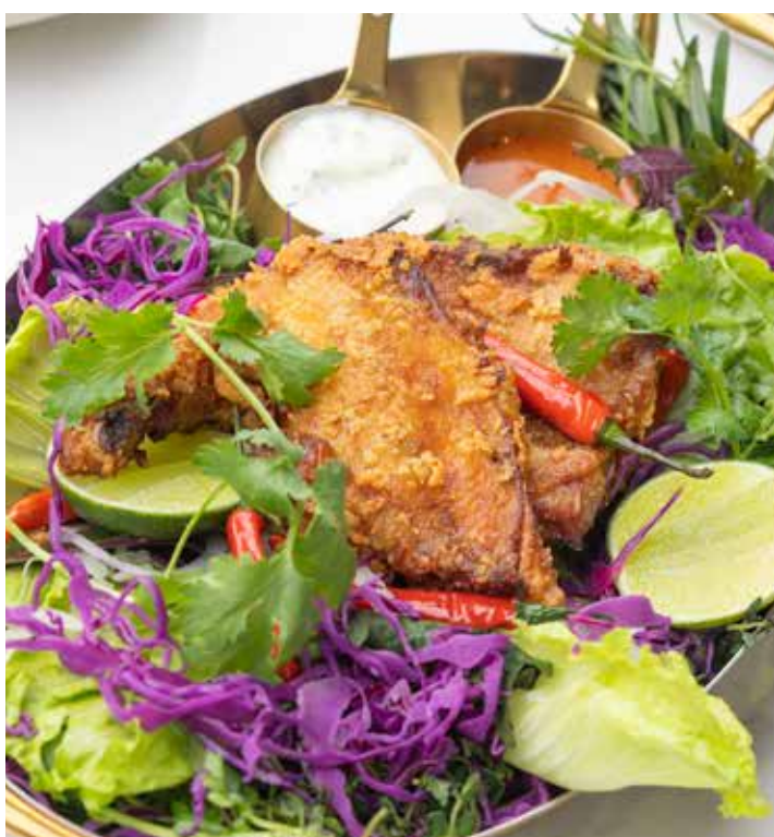
Crispy Fried Spring Chicken Ranch Dressing | Honey Hot Sauce 脆炸春鸡 | 法式酱汁 | 蜂蜜辣味酱汁

Green Salad | Jalapeno | Gherkin 蔬菜沙拉 | 墨西哥辣椒 | 酸黄瓜