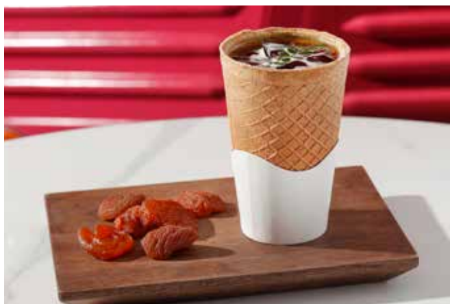
Iced Apricot Americano 黄杏冰美式