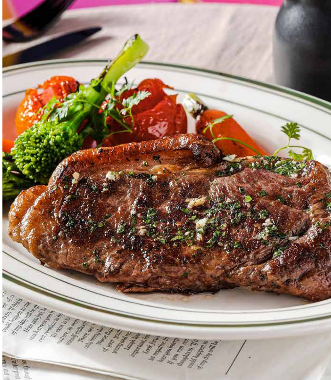
Australia Wagyu Sirloin M3+ 原切澳洲M3+和牛西冷牛排(180G)