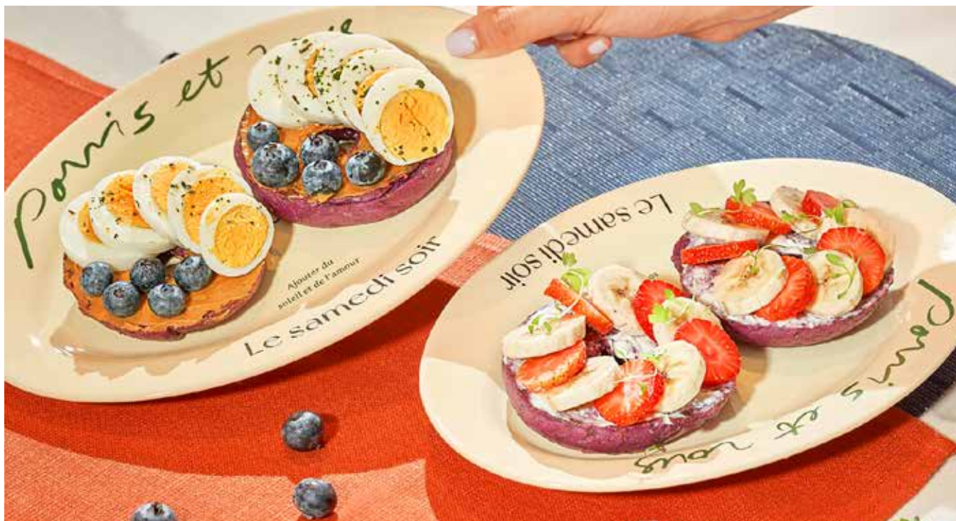
E.D.I.T. Strawberry Banana Bagel 玛珂草莓香蕉贝果