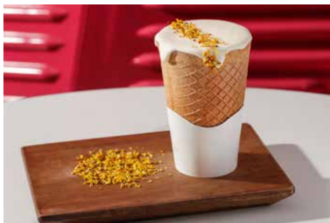
Osmanthus Cheese Foam Latte 桂花奶盖拿铁