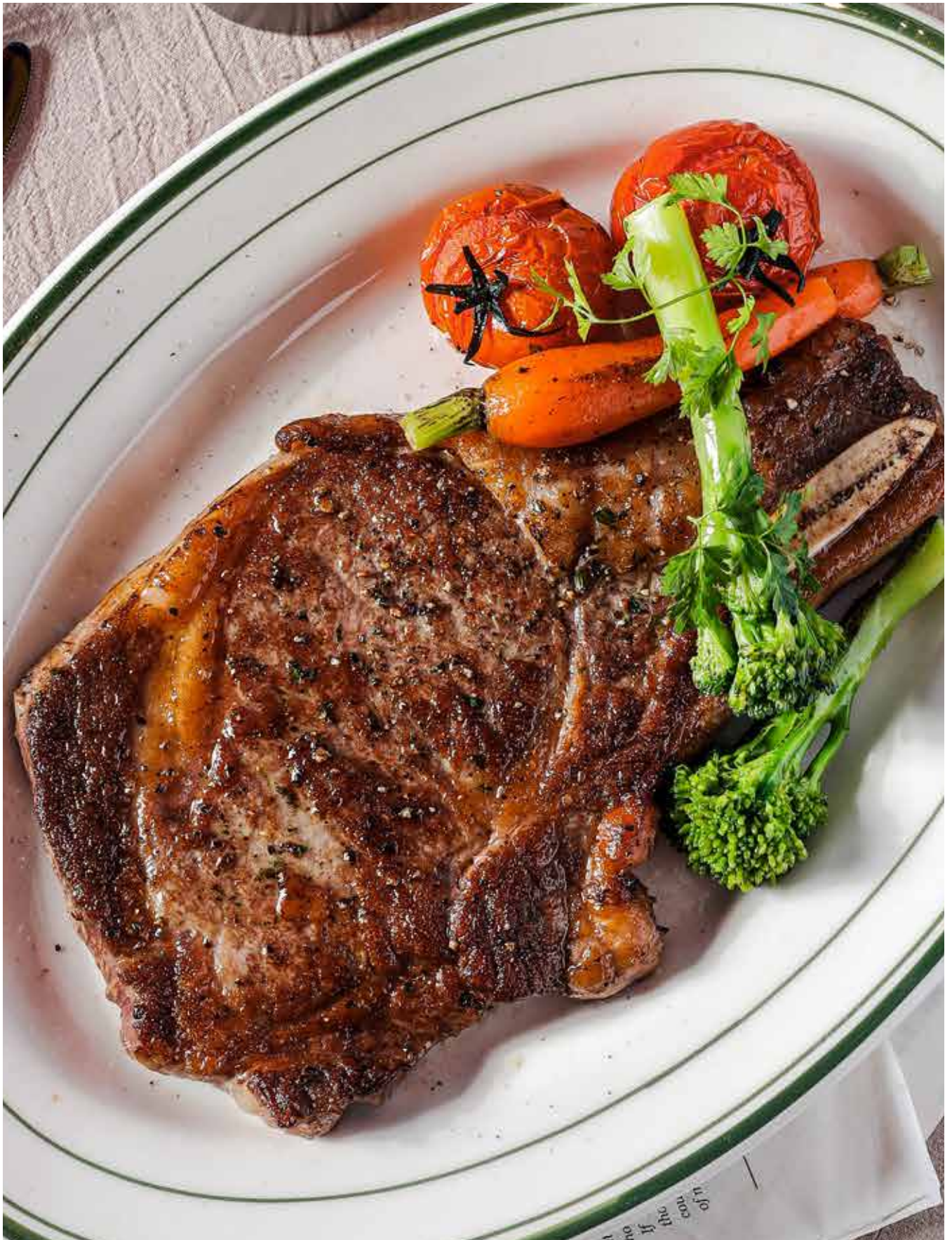
Tomahawk Steak 550gm Share 2-3 People 战斧牛排 (供2-3人客享)