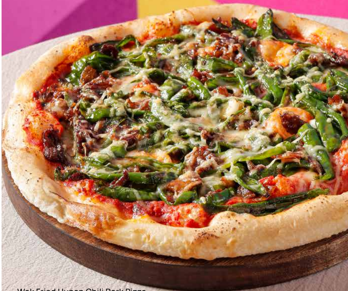
Wok Fried Hunan Chili Pork Pizza 湖南辣椒炒肉披萨