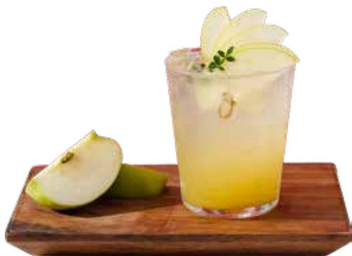
Apple Melon Camellia Tea 青苹果蜜瓜山茶